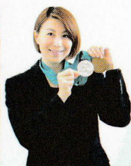
中村 真衣 (なかむら まい) シドニーオリンピック水泳女子100m背泳ぎ銀メダル・女子4×100mメドレーリレー銅メダル