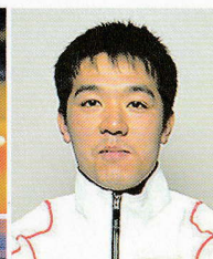
遊澤 亮 (ゆざわりょう) アトランタオリンピック卓球男子ダブルス日本代表/アテネオリンピック卓球男子シングルス・ダブルス日本代表