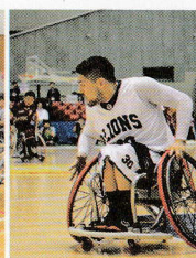
埼玉ライオンズ 1978年結成/2018年日本車いすバスケットボール選手権大会3位